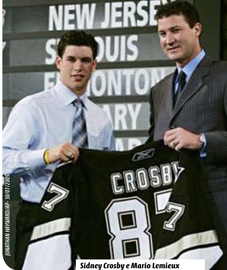
Sidney Crosby e Mario Lemieux