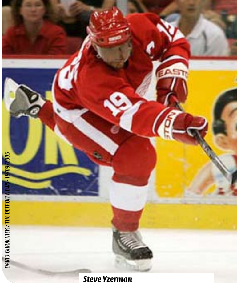
19/09/2005